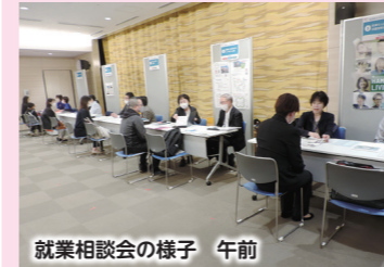
就業相談会の様子 午前