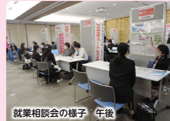
就業相談会の様子 午後